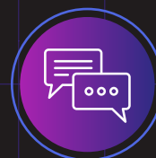
DIÁLOGOS REGIONALES DE POLÍTICAS