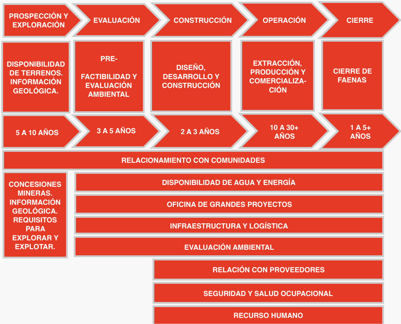
Figura 1. Institucionalidad minera: áreas críticas.

bloque puede avanzar más allá del protocolo comercial acordado, abordando una estrategia conjunta de negociación con socios comerciales extrabloque que maximice su apertura y competencia. Esto debe acordarse institucionalmente y con visión estratégica, sin perjuicio de instrumentos específicos para proveedores locales.