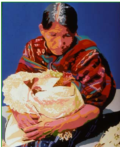
Mayan Blue (Tristeza Maya) , 1999