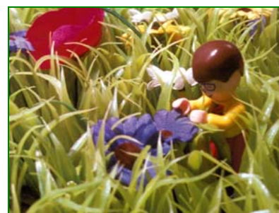
Oliendo Flores, de la serie paisajes de plástico (Smelling Flowers, from the Series Plastic Landscape) , 2002