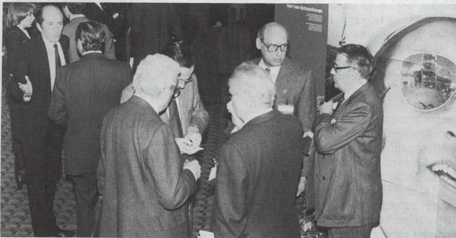
Establecer nuevos contactos o renovar los ya establecidos. Esto forma parte de la importante, aunque no oficial, agenda de uno de los principales encuentros financieros del mundo: la reunión de la Asamblea de Gobernadores del BID, cuya realización tuvo lugar recientemente en Madrid.

Otros inversores presentes en Madrid coincidieron. “Nosotros estamos muy interesados en los programas y políticas del BID” dijo el representante en Londres de una firma multinacional de inversión. “La Asamblea es además una extraordinaria oportunidad para reunir también a todos los miembros de nuestro equipo internacional. Usted encontrará aquí nueve funcionarios de nuestra firma, incluyendo nuestros representantes en Tokio, Nueva York y nuestra oficina en Europa.