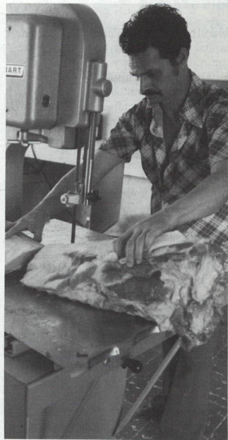
Con la sierra eléctrica, el cuarto trasero se convierte rápidamente en costillas, en la Carnicería Los Gemelos (arriba). La electricidad también permite a la Mueblería Colonial fabricar más sillas y mesas y emplear a más gente. (abajo)

Como en Jicaral, la luz llega a casas y comunidades a lo largo de América Latina mediante programas de electrificación rural financiados con recursos del B.D. Como proyectos sociales, resultan básicos para los propósitos del Banco, que son contribuir a mejorar las condiciones de vida y hacer del desarrollo una realidad para todos.