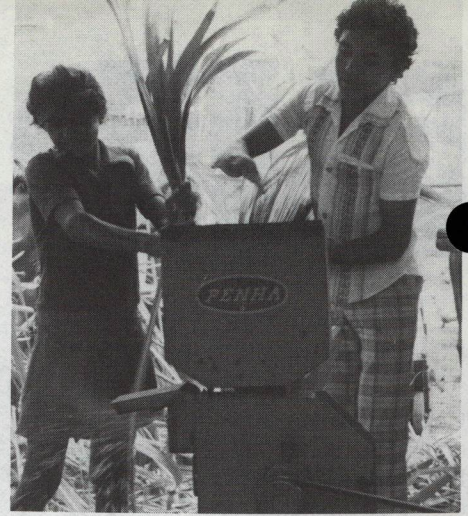
Un simple molino eléctrico es todo lo que necesita este productor lechero brasileño para convertir la caña de azúcar en alimento para el ganado.