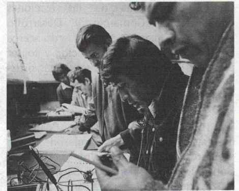
En escuelas vocacionales (arriba) y en cátedras universitarias (abajo), los estudiantes latinoamericanos se preparan para llevar a sus países hacia un futuro mejor.

Noticias del BID es una publicación mensual del Banco Interamericano de Desarrollo. Se distribuye gratuitamente. Todo el material puede reproducirse mencionando la fuente. Dirección: 808 17th Street, N.W., Washington, D.C. 20577, Estados Unidos de América.