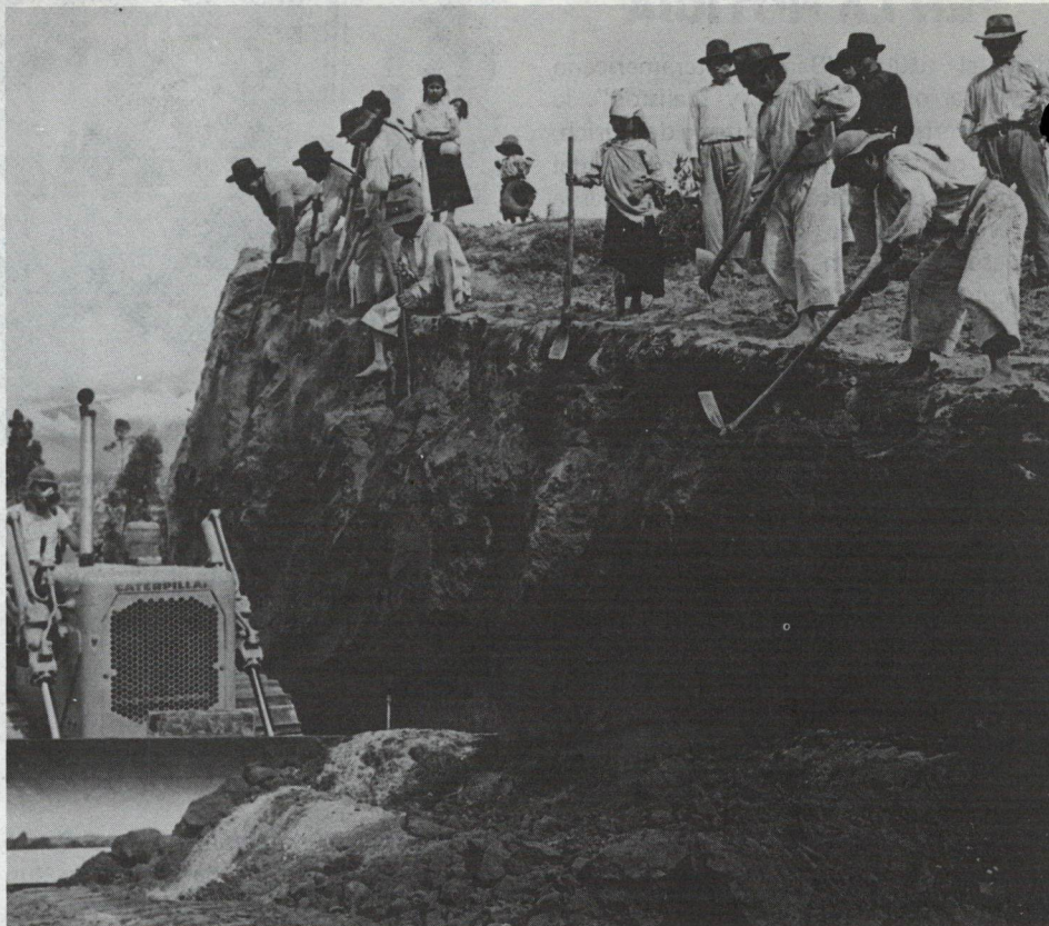
La creación de oportunidades de empleo es uno de los principales objetivos de los proyectos que el Banco financia, basados en la utilización de tecnologías intermedias.

El Comité para la Aplicación de Tecnologías Intermedias tuvo un importante papel en los esfuerzos del