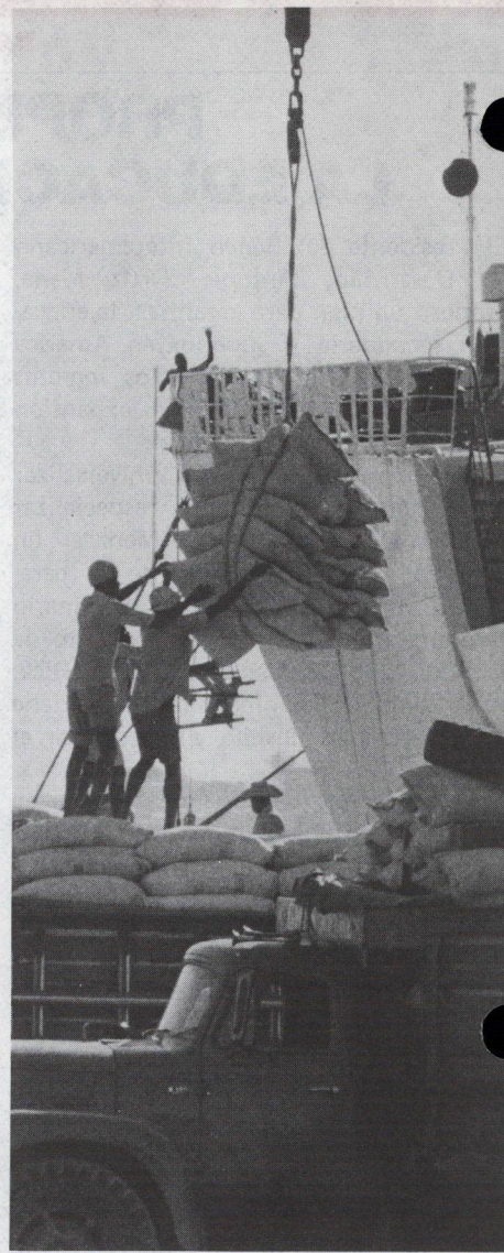
A mucha distancia de los muelles, negociadores de alto nivel buscarán maneras de equilibrar el inestable mercado de productos primarios, que afecta en forma adversa a las economías de América Latina.

El proteccionismo en los países industrializados, continúa siendo el obstáculo más serio que enfrentan los países en desarrollo en sus esfuerzos por introducir en esos mercados sus productos. Los resultados de la reciente Rueda de Negociaciones Multilaterales sobre Comercio de Tokio , bajo el Acuerdo General sobre Aranceles Aduaneros y Comercio (GATT), fueron limitados, y beneficiaron principalmente a los productores manufactureros. Sin embargo, los acuerdos GATT lograron un menor diferencial de aranceles aduaneros entre materias primas y productos semimanufacturados. El resultado de esto ha sido un estímulo al procesamiento interno de materias primas, un importante objetivo de los países en desarrollo. En el pasado, la industria