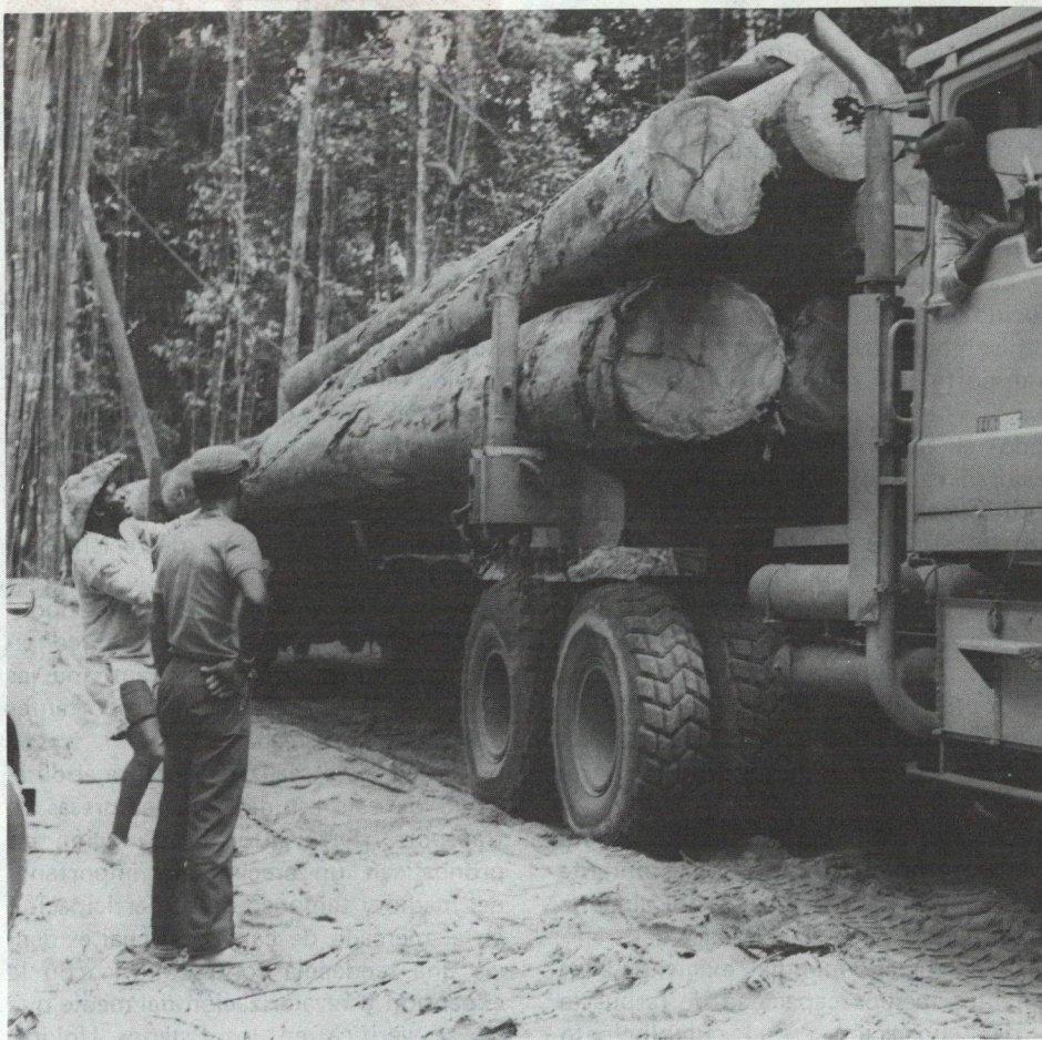
Madera para la construcción, para fabricar papel y para obtener energía. Guyana y otros países de América Latina tienen un enorme potencial bioenergético, además de su alto potencial en otras tecnologías de producción de electricidad.

Una cooperación técnica no reembolsable del Banco suministró financiamiento a un instituto de investigación de Centroamérica para desarrollar una gama de tecnologías intermedias, entre ellas la utilización de desechos agroindustriales para producir combustibles, y de energía solar para secar granos. Otro financiamiento no reembolsable del