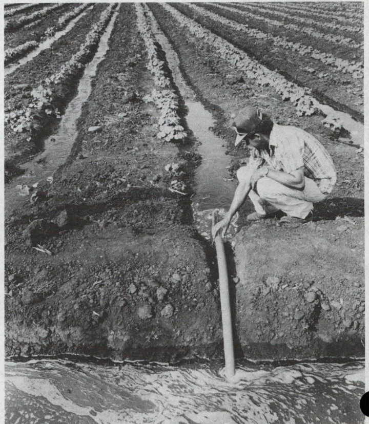
El agua del Lago Arenal se bombea desde un canal de riego hacia una plantación de nuevas variedades de melón. Casi 120.000 hectáreas de la provincia norteña de Guanacaste se beneficiarán con el programa.

El latifundio predominaba en la región pero en la actualidad la situación ha cambiado ya que muchas de las grandes fincas se han vendido para ser parceladas con participación muy importante del Gobierno, que ha adquirido grandes extensiones para asentamientos de pequeños campesinos. Cerca de un 55 por ciento de tierras con irrigación pertenecerán a pequeños y medianos productores con la perspectiva de que este porcentaje se incrementará en el futuro.