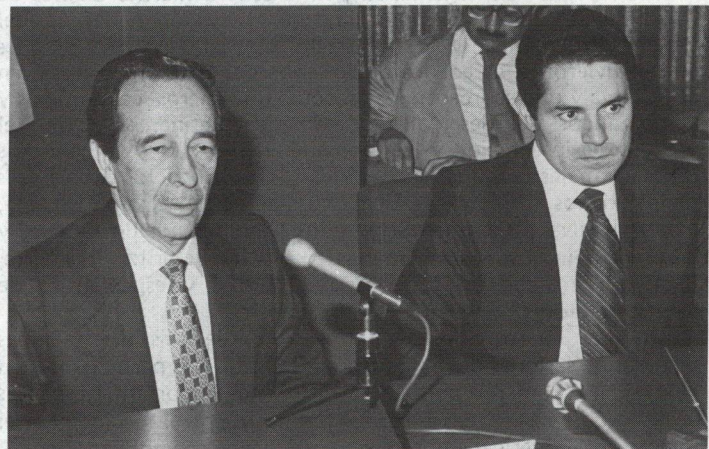
El Presidente del BID, Antonio Ortiz Mena hace uso de la palabra en la firma de un contrato de préstamo por $13,9 millones para un programa de educación superior en Panamá, que se llevó a efecto el 11 de mayo en la sede del Banco. Lo acompaña el excelentísimo señor Presidente de Panamá, Aristides Royo, quien firmó el contrato como testigo de honor.

• Proyecto B, que será ejecutado por USMA, incluye la construcción de edificios para laboratorios, centros de administración y de procesamiento de datos, centro de estudiantes y salas de clases; la compra de equipo necesario para cursos tecnológicos; provision de libros de texto y de otras publicaciones.