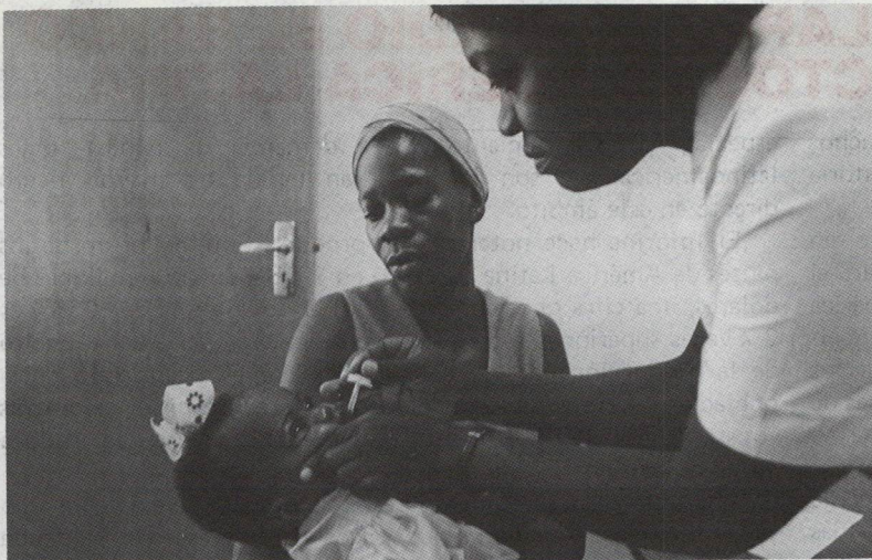
Una enfermera aplica una vacuna en una clínica rural en Trinidad y Tobago. El 10 por ciento de 14.000 millones de dólares que totalizan los préstamos otorgados por el Banco en el período 1961-1979, se han dedicado a mejorar la salud en distintas regiones de América Latina.