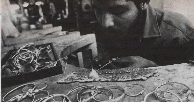
Las hábiles manos de estas operarias de una fábrica de cigarros de Kingston, elaboran un producto que cuenta con amplio mercado en el Caribe, México, Estados Unidos, Canadá y Europa. Ar., un orfebre soldando las partes de una delicada pulsera de plata, que adquirirán los turistas que visitan Jamaica. Los préstamos del BID ayudan a Jamaica a ganar divisas extranjeras.