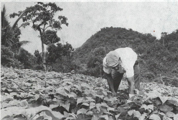
Godfrey Thomas, un pequeño agricultor jamaquino que ha convertido su explotación de monocultivo en una de cultivos múltiples, y en el proceso salió del nivel de agricultura de subsistencia, inspecciona su plantación de guisantes. Thomas ha recibido subpréstamos del BID por un total de 5.000 dólares.

Una tercera parte de la población de América Latina, es decir más de 100 millones de habitantes, viven en condiciones de casi extrema pobreza, y en su gran mayoría en áreas rurales. Es por ello que en sus programas crediticios, el Banco Interamericano