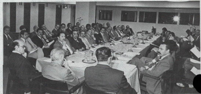
Un aspecto del seminario celebrado en la sede del BID. Según los expertos, América Latina tiene capacidad para investigar y resolver los problemas del desarrollo rural.