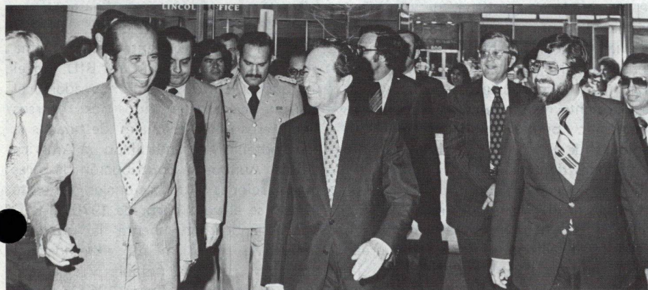
El Presidente de Venezuela, Carlos Andrés Pérez (izq.) es recibido en la entrada del BID por el Presidente del Banco, Antonio Ortiz Mena (centro) y altos funcionarios de la institución. El Presidente venezolano dijo que el préstamo del BID a Honduras, concedido con recursos de Venezuela, constituye un verdadero ejemplo de entendimiento latinoamericano.