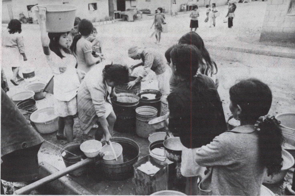
(De la página 1)

personal y riego, hay que sumar el peligro de las enfermedades provenientes de la utilización de aguas contaminadas, tifoidea, cólera, disentería, amebiasis y enteritis, que afectan cada año en el mundo a 250 millones de personas. En este sentido, puede decirse que el problema del agua tiene dos facetas: la provisión de agua y la existencia —y utilización— de aguas contaminadas.