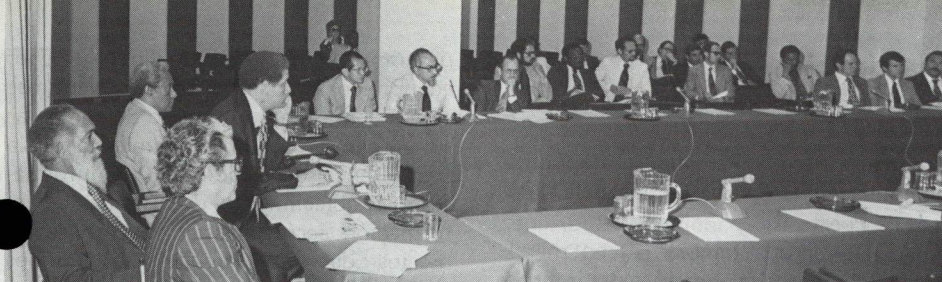
Seminario en el BID: El Caribe y las Américas. Diferentes aunque semejantes.