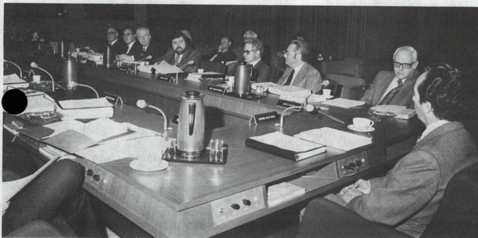
El Directorio Ejecutivo del BID en sesión, en Washington. Los préstamos del Banco contribuyen a la ejecución de obras y programas cuyo costo total excede los 41.000 millones de dólares.

Un índice de la dinámica adquirida por el Banco en esos 16 años de operaciones es la progresión con que fueron siendo adjudicados anualmente los préstamos. En sus primeros cinco años de operaciones (1961-1966), el Banco concedió préstamos por un total de aproximadamente 1.500 millones de dólares. Al completar su primera década de actividades los préstamos concedidos habían alcanzado a poco más de 4.000 millones de dólares y en el período transcurrido desde 1971 hasta ahora, se autorizaron los 6.000 millones de dólares restantes. En el quinquenio 1971-1975 el volumen de préstamos concedido superó al acordado en toda la década anterior.