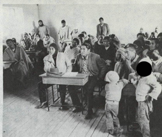
Campeños de una comunidad indígena del Perú reunidos en una de las aulas de la escuela local, reciben información acerca de las técnicas de los cultivos y el uso de modernos insumos. El adiestramiento de los campesinos es parte fundamental de los programas de desarrollo rural integrado que lleva a cabo el gobierno peruano.

La causa de esta situación era la carencia de personal adiestrado en la compleja tarea de planificar la inversión y de formular y evaluar proyectos específicos. El Banco puso énfasis en la tarea de reforzar los mecanismos nacionales de planificación y de formar "proyectistas". Para alcanzar esta finalidad, los conocimientos básicos teóricos fueron complementados con la preparación hasta nivel de prefactibilidad, de proyectos reales que interesaban a los respectivos gobiernos. La importancia de varios de estos estudios, permitió que fueran posteriormente complementados y que recibieran financiación oportuna. Otros han servido de base para la preparación de material docente y de manuales y metodologías de enseñanza adaptados a las necesidades del país respectivo. Otra necesidad que quedó evidenciada fue la de mejorar la administración, aplicada a los préstamos, proyectos e instituciones. La formación de más personal idóneo y de entidades administrativamente eficientes, se hizo a través de programas que enfocaron desde la capacitación individual hasta el fortalecimiento de las entidades, mediante lo que el Banco llama "refuerzo institucional".