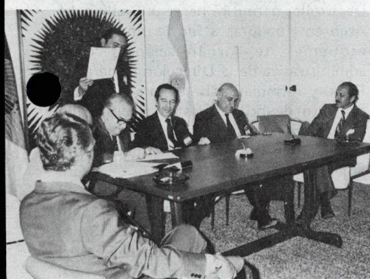
En la reunión de Santo Domingo, el Presidente del BID formalizó importantes operaciones: un préstamo a la República Dominicana (arriba), un convenio anexo al contrato de fideicomiso con Venezuela y préstamos a la Argentina por 134 millones de dólares.

Colombia, Estados Unidos, México, Nicaragua y Venezuela, a los cuales se agregarían representantes de otros países miembros, que antes del 1 de junio de 1975, manifiesten a la Administración del Banco su interés en participar en la consideración de esta materia. 3) Recomendar que el Directorio Ejecutivo ejerza una supervisión ininterrumpida sobre los esfuerzos de la Administración en apoyo del pronto cumplimiento de los trabajos del grupo y que los Directores Ejecutivos mantengan debidamente informados a los países que representan. 4) Pedir al Presidente del Banco que convoque las reuniones del grupo de trabajo, debiendo celebrarse la primera de ellas a más tardar el 15 de julio de 1975. 5) Recomendar que el grupo de trabajo se reúna en lo sucesivo con la frecuencia necesaria para poder presentar un informe final y recomendaciones a más tardar el 1 de septiembre de 1975, a fin de que la Asamblea de Gobernadores pueda considerarlos en una reunión especial que tendrá