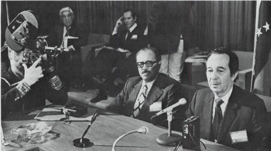
El ministro Hurtado y Ortiz Mena durante la ceremonia. El Fondo: una actitud "generosa y amplia".

El Comité expresó su conformidad con los términos del contrato entre el Fondo de Inversiones de Venezuela y el Banco