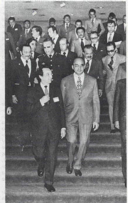
El Presidente del BID, Antonio Ortiz Mena (izq.); el Presidente de México, Luis Echeverría, y autoridades, en la inauguración de la conferencia sobre financiamiento latinoamericano celebrada en México (Pág. 3)