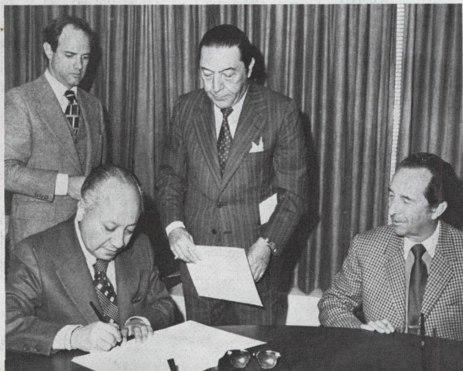
El embajador ecuatoriano ante la Casa Blanca, José C. Cárdenas, en presencia del Presidente del BID, Antonio Ortiz Mena, y de funcionarios del Departamento Legal del Banco, suscribe la documentación que formaliza una operación de préstamo de 11,1 millones de dólares, concedidos por el BID para contribuir a la construcción de la carretera Loja-Velacruz-Saracay, en el Ecuador.

Los préstamos —uno por 11,5 millones de dólares del Fondo para Operaciones Especiales del Banco y otro por 2,5 millones del Fondo Noruego para el Desarrollo de América Latina, que administra el Banco— serán utilizados por el Ministerio de Salud Pública y Asistencia Social para suministrar servicios médicos básicos a aproximadamente 1.500.000 habitantes de zonas rurales para 1980.