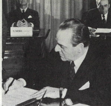
Embajador Ettore Staderini, de Italia