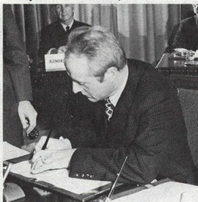
Embajador Klaus Jacobi, de Suiza