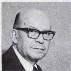
El autor de este estudio es el economista Milic Kybal, Asesor del Departamento de Desarrollo Económico y Social del Banco Interamericano de Desarrollo.

Hasta años recientes, el mercado de eurodivisas se ocupaba principalmente de facilitar recursos al sector privado de los países industrializados. Sin embargo, desde 1971, los países en desarrollo están captando un gran volumen de recursos en este mercado. Eso se debe a que los prestatarios tradicionales se han volcado a sus respectivos mercados nacionales de capitales, ya sea por disposiciones oficiales, o por el crecimiento extraordinario de la disponibilidad de fondos en esos mercados. En tales condiciones se agudizó la competencia entre los "eurobancos" que se lanzaron con gran agresividad a conseguir prestatarios en los países en desarrollo, ofreciendo condiciones más atractivas de interés y plazos. Por otro lado, el auge económico mundial y los altos precios de los productos básicos, mejoraron la elegibilidad de muchos países en desarrollo como prestatarios.