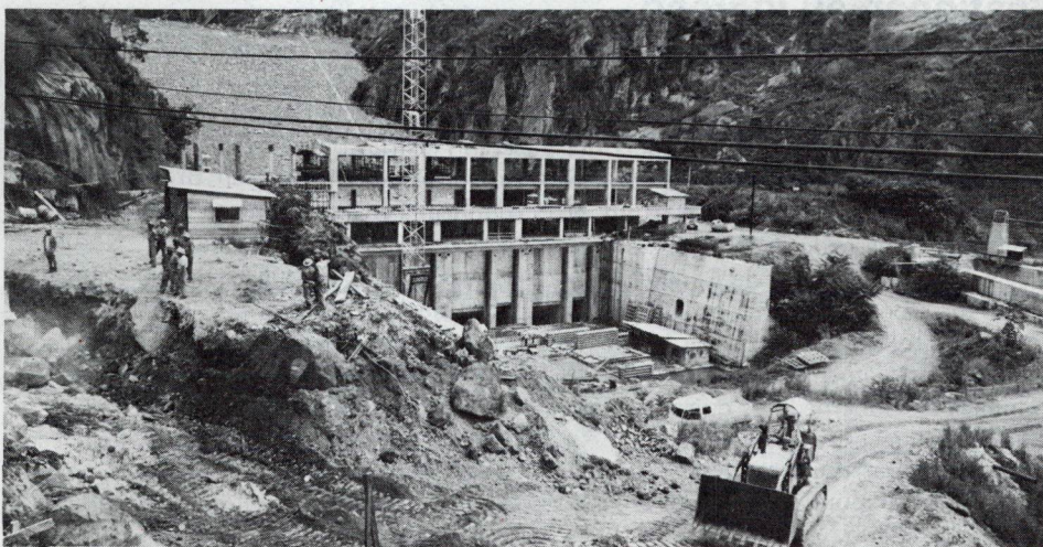
Entre las obras terminadas está la central hidroeléctrica del Río Prado, situada en el Tolima

trucción de tres centrales generadoras, con una capacidad total de 175.000 kilovatios, en los Departamentos de Caldas, Huila y Santander; está contribuyendo a la ampliación de quince sistemas de transmisión y distribución, incluyendo los de Bogotá, Cali, Manizales y sus áreas vecinas; y coopera en el financiamiento de las dos plantas de mayor capacidad que se están montando en el país, la del Alto Anchicayá (340.000 kilovatios) y la de Chivor (500.000 kilovatios). La primera, localizada a 50 kilómetros de Cali, beneficiará principalmente al Valle del Cauca, una región de 40.000 kilómetros cuadrados, con abundantes recursos naturales y tierras cultivables de alta calidad, que comprende territorio de los Departamentos del Valle y el Cauca. La segunda, situada a 120 kilómetros de Bogotá, en el Departamento de Boyacá, servirá fundamentalmente a la región central del país.