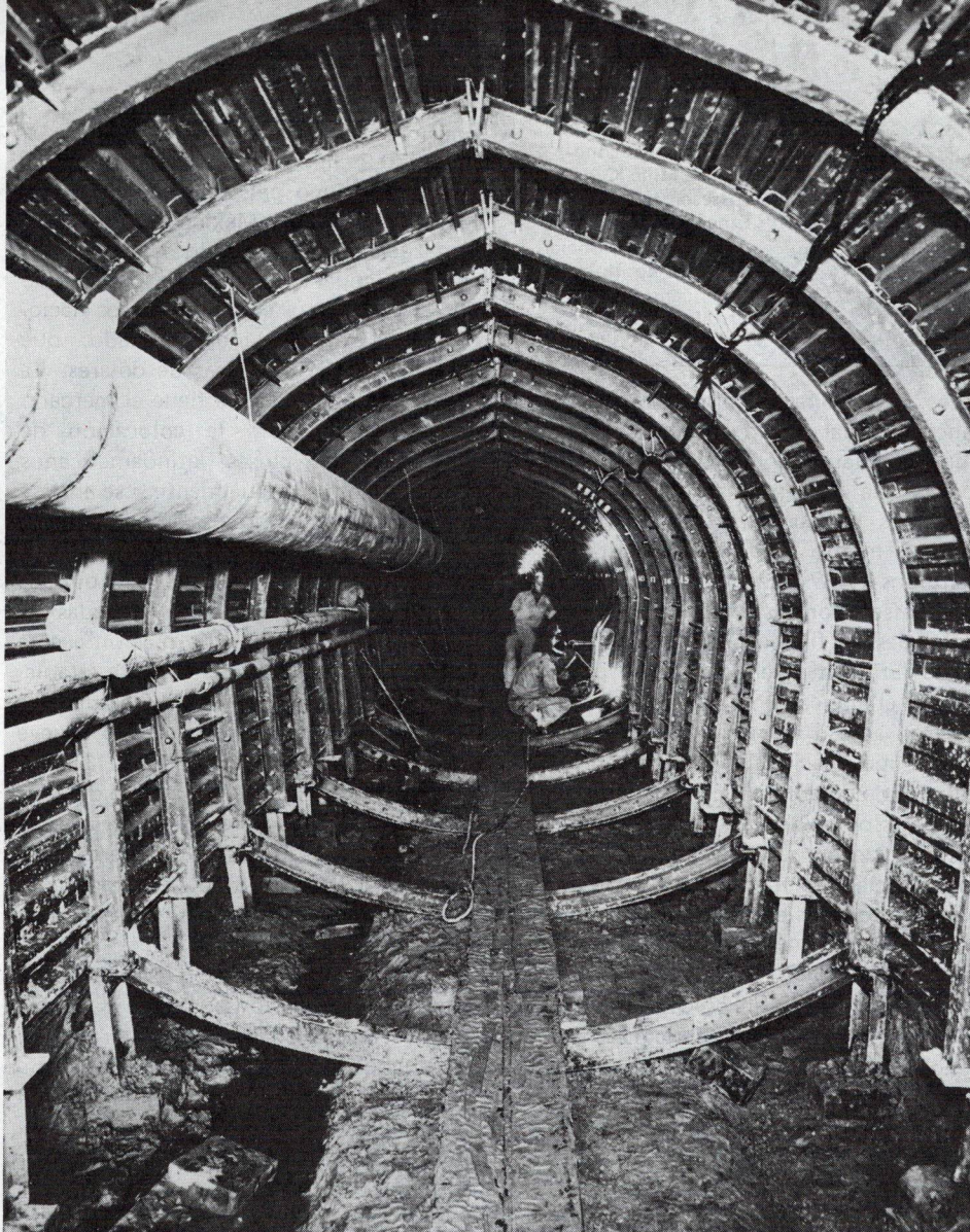
Medellín, la segunda ciudad del país, ha recibido más de 31 millones de dólares para saneamiento

italiano IMPREGILO bajo un contrato por valor de 60 millones de dólares.