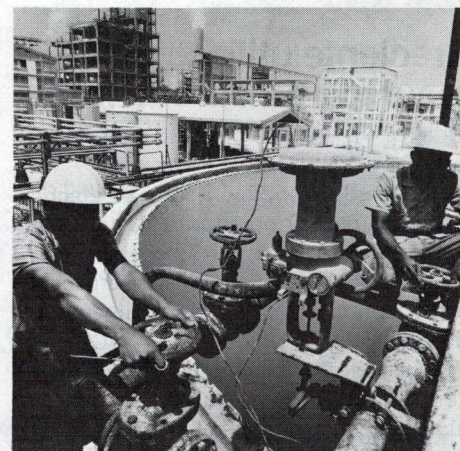
Planta de soda en las afueras de Cartagena

Después de la energía eléctrica, los campos en los cuales se destaca más la acción del Banco son el agropecuario y el del transporte. En el primero, ha contribuido a suministrar crédito, maquinaria y asistencia técnica a cerca de 15.000 familias campesinas, y a adelantar vastas campañas de investigación y de sanidad animal, entre estas últimas la de control de la fiebre aftosa y la brucelosis del ganado, dentro de la cual se contempla la producción de 27 millones de vacunas al año. En el segundo, se ha traducido en la construcción o mejoramiento de más de 2.000 kilómetros de carreteras y caminos vecinales, y en la modernización de los cuatro principales puertos marítimos del