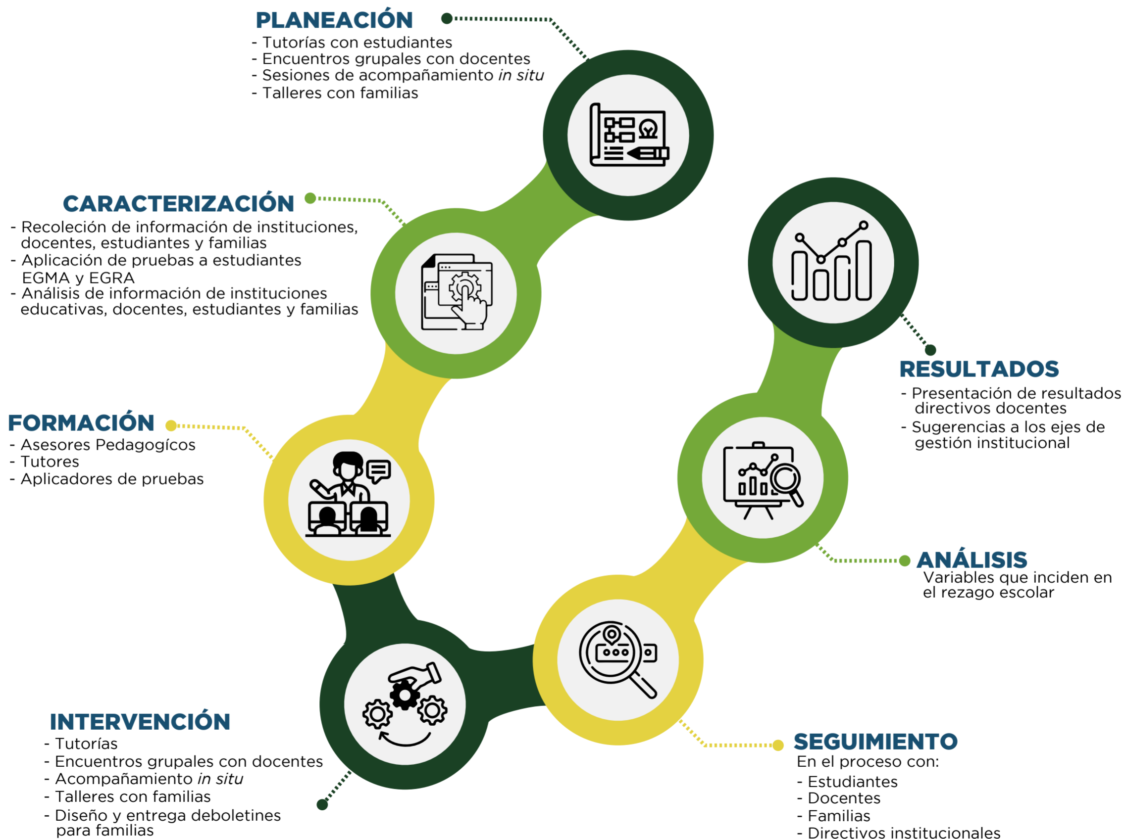
Figura 1. Esquema Aula Global

La estrategia metodológica adoptada por el programa Aula Global, invita a los estudiantes a desafiarse todo el tiempo por aprender nuevos conocimientos, propone una misma actividad para todos los estudiantes de segundo a quinto de primaria, la cual está centrada en un mismo eje temático, pero con múltiples niveles de desempeño. Cada estudiante participa activamente desde el grado de competencia o habilidad que haya alcanzado en el momento, la dinámica propuesta genera escenarios retadores que invitan a los niños a intentar alcanzar el próximo nivel.