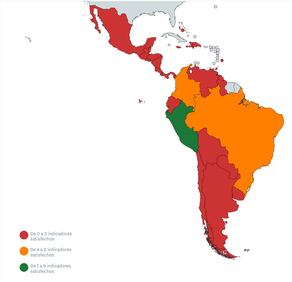
FIGURA 6: Mapa mostrando el cumplimiento de indicadores en materia de autonomía personal y financiera por país