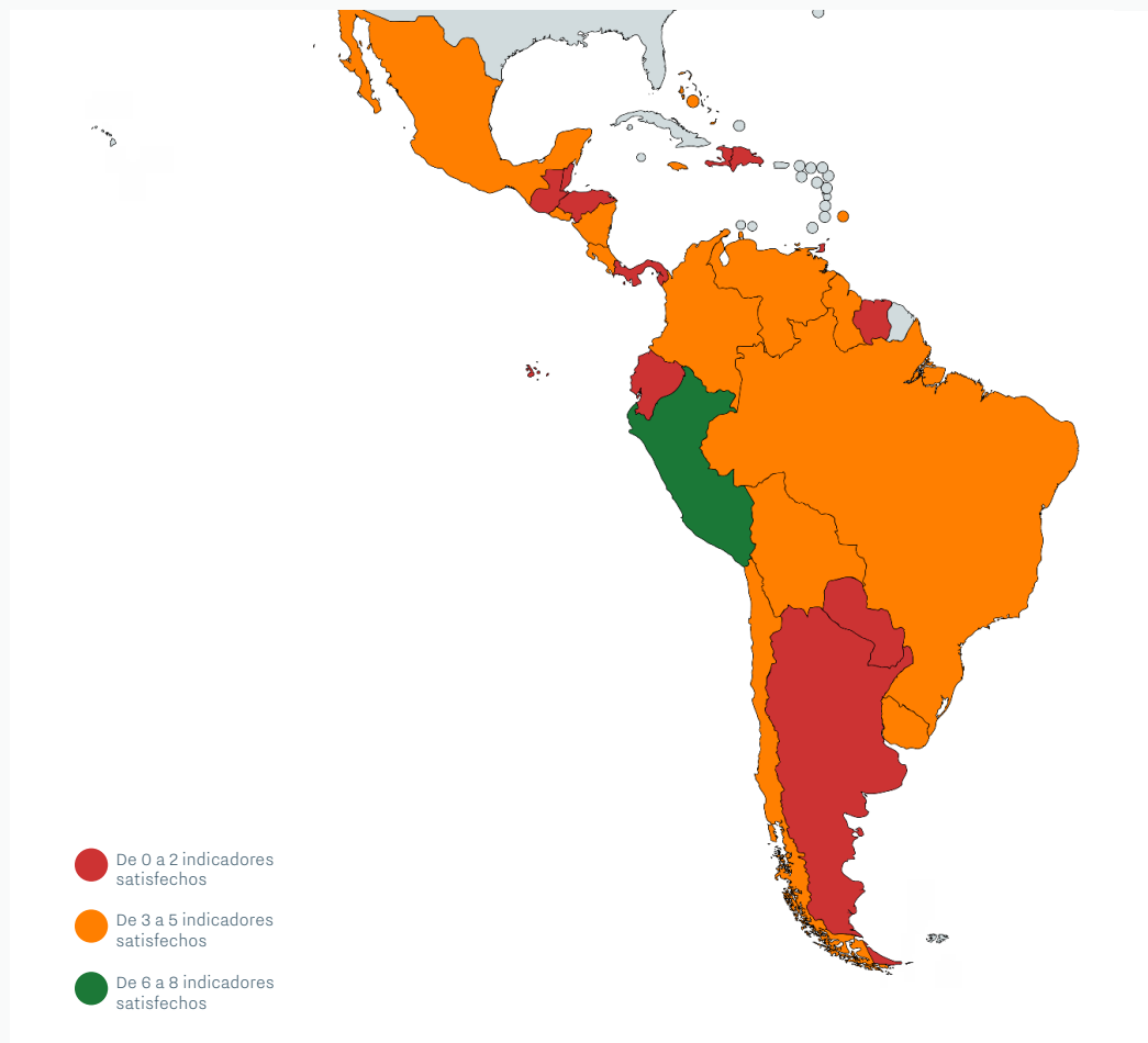
FIGURA 5: Mapa mostrando el cumplimiento de indicadores en materia de acceso al empleo por país