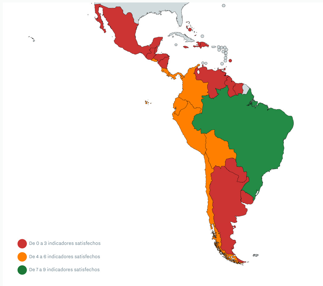
FIGURA 7: Mapa mostrando el cumplimiento de indicadores en materia de participación política por país