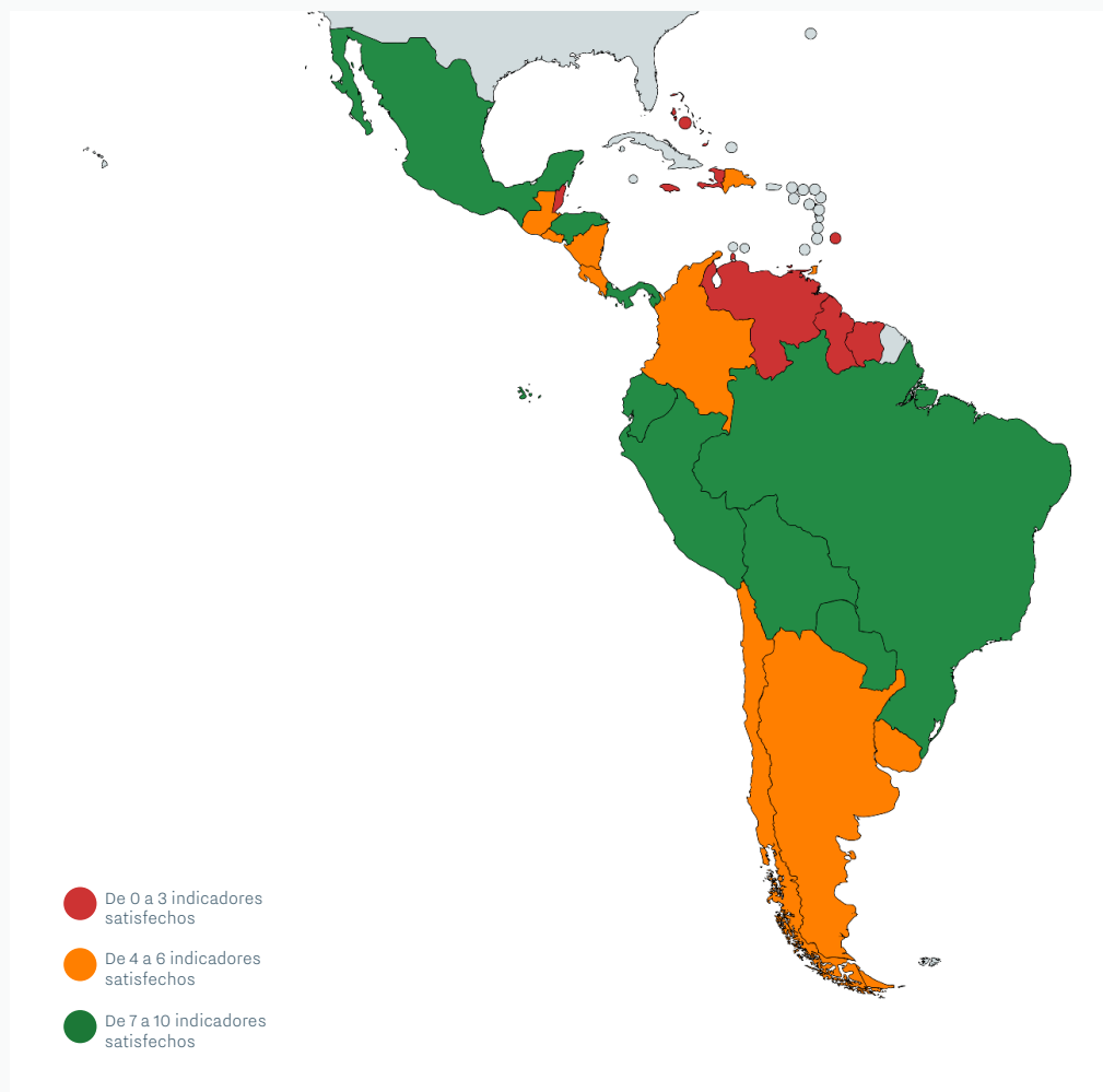
FIGURA 4: Mapa mostrando el cumplimiento de indicadores en materia de educación por país