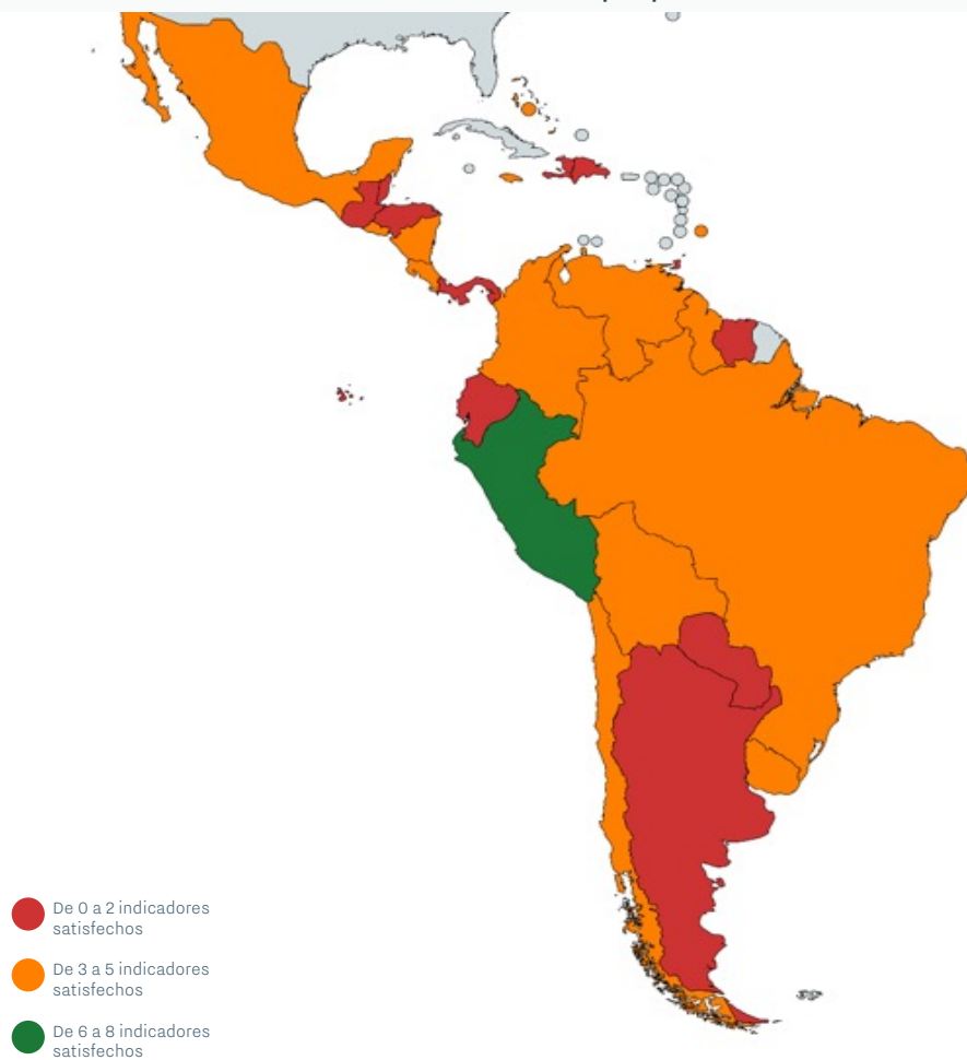
FIGURA 3: Mapa mostrando el cumplimiento de indicadores en materia de salud por país