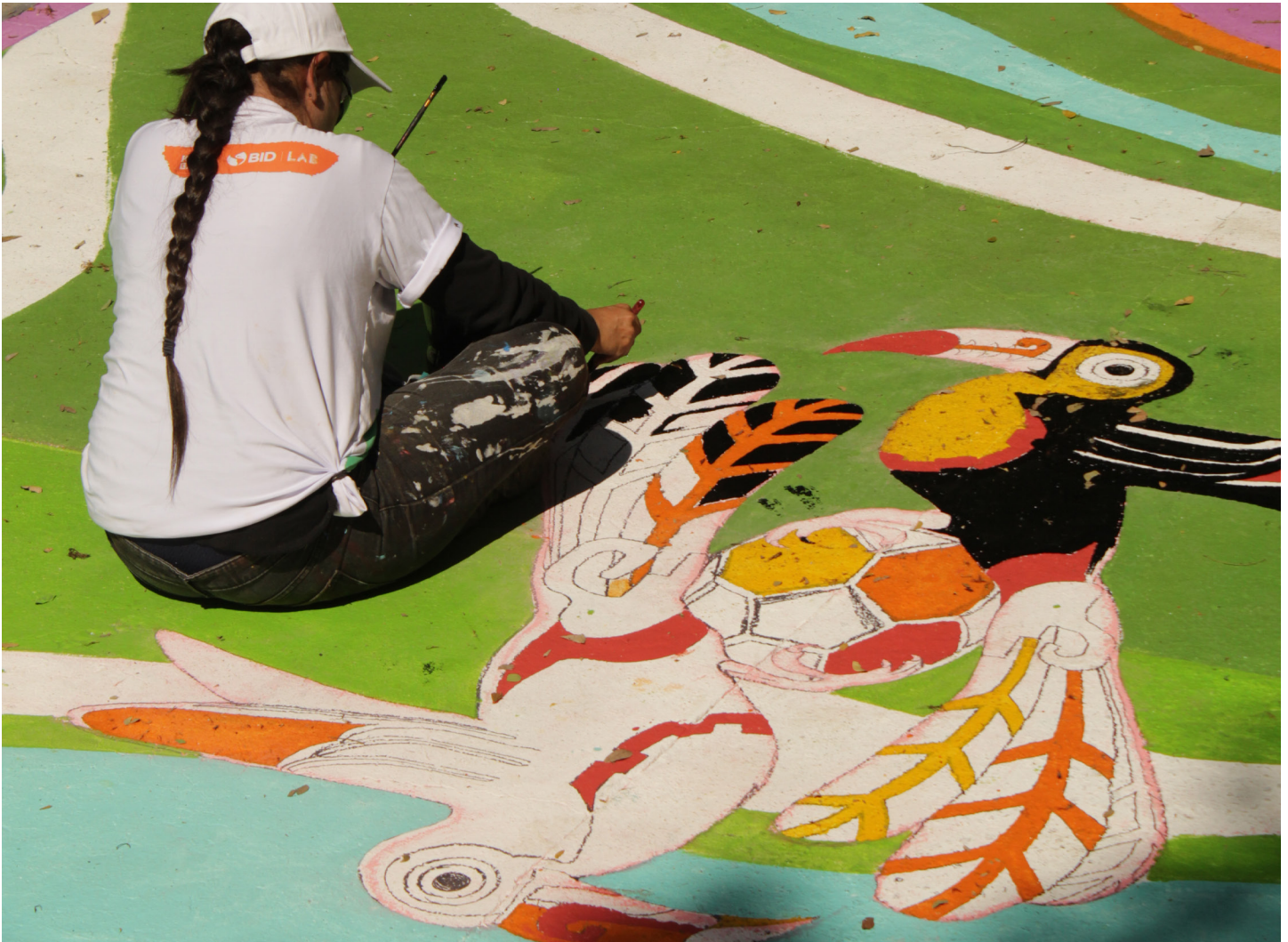
EL SALVADOR: Un proyecto de BID Lab ha contribuido a recuperar espacios públicos, restaurar el tejido social y mejorar la formación profesional de los jóvenes en barrios vulnerables del país.

crecimiento de los empleados. En paralelo, el Banco lanzó Talent+, una plataforma actualizada de SAP SuccessFactors que mejora la integración de datos y la agilidad, y simplifica procesos.