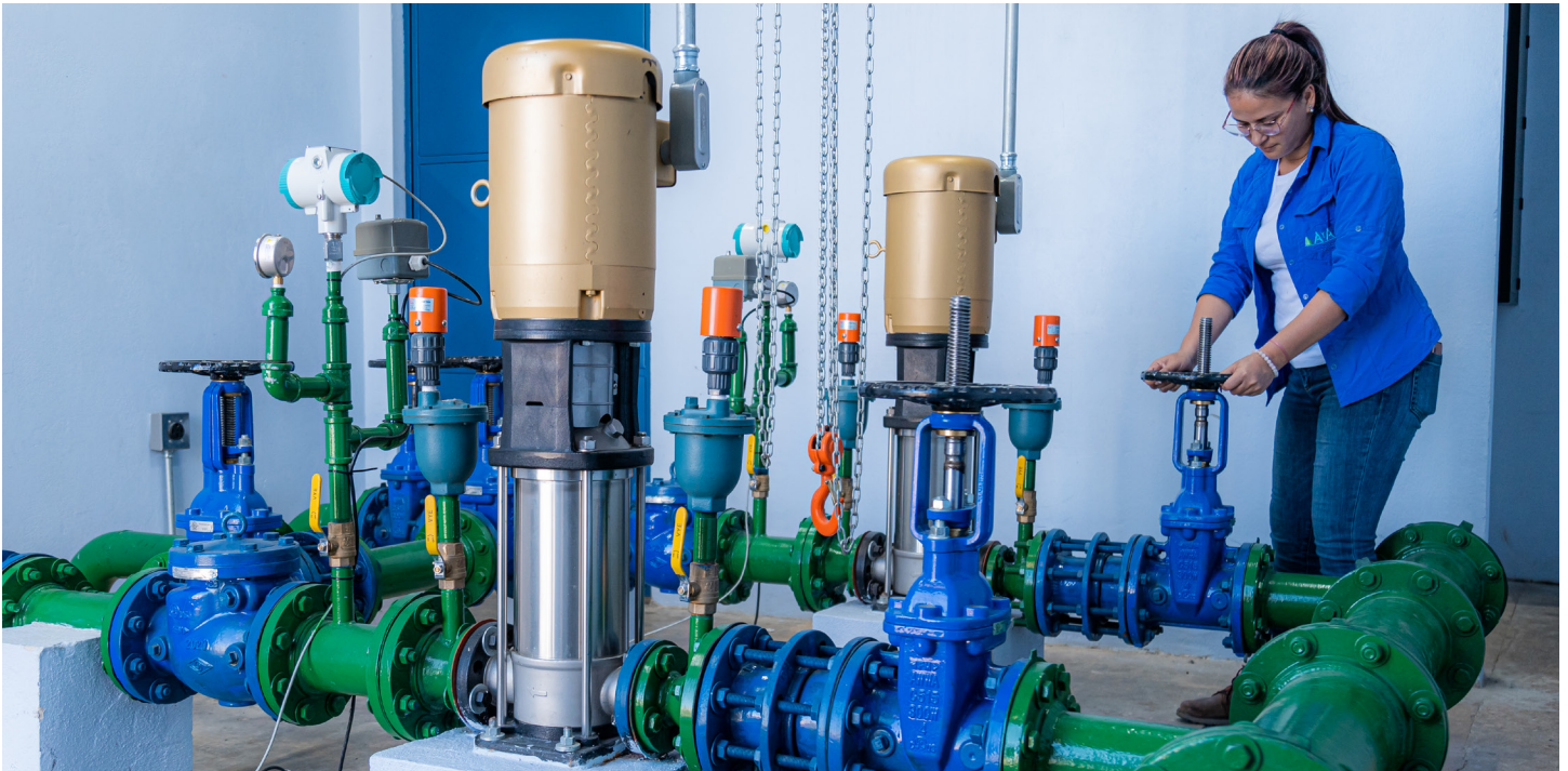
COSTA RICA: El BID financia la ampliación de la cobertura y la mejora de la calidad de los servicios de agua y saneamiento, generando beneficios para la salud y el entorno ambiental en la capital, así como en ciudades y zonas rurales de todo el país.

financieros y la movilización, las sinergias a nivel del Grupo y otras áreas de planificación, capacidad y efectividad.