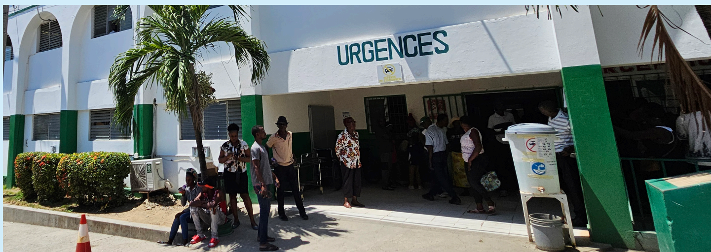
HAITÍ: Un programa del BID amplía el acceso a servicios esenciales de salud y refuerza el sistema sanitario en la región del Gran Norte del país.

Estos esfuerzos reflejan el compromiso del BID de canalizar recursos hacia países que enfrentan situaciones de fragilidad aguda, en el marco de la Alianza Global contra el Hambre y la Pobreza , lanzada en la Cumbre del G20 en Río de Janeiro en 2024. El apoyo del BID a Haití se centró en programas de empleo temporal y capacitación para jóvenes, salud materno-infantil y alimentación escolar, en el contexto de la Iniciativa de Vía Rápida ( Fast Track Initiative ) de la Alianza.