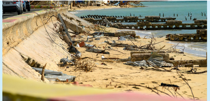
JAMAICA: Un paquete integral de financiamiento respaldará las necesidades de recuperación tras el huracán Melissa.

Ante una proyección de daños de US$8.800 millones, la recuperación requerirá recursos importantes e inversiones a largo plazo. Para esto, podría ponerse a disposición un paquete de apoyo financiero de hasta US$3.600 millones con el fin de financiar el programa de recuperación y reconstrucción del gobierno durante los próximos tres años, incluyendo hasta US$1.000 millones en financiamiento soberano del BID en áreas prioritarias donde la experiencia técnica y el acompañamiento a largo plazo del Banco pueden generar un impacto sostenido.