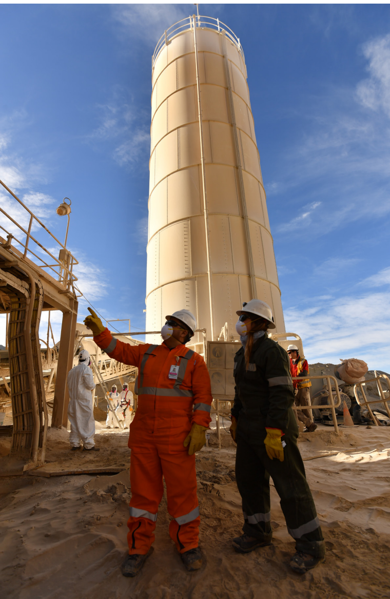
ARGENTINA: El BID está apoyando el desarrollo integral del sector del litio, desde la etapa de exploración hasta la extracción y la gobernanza.

estrictos estándares ambientales y sociales. Los avances en Argentina, Brasil, Chile, Ecuador, Perú y República Dominicana consistieron en la modernización de la normativa, la generación de datos geológicos, el fortalecimiento de la