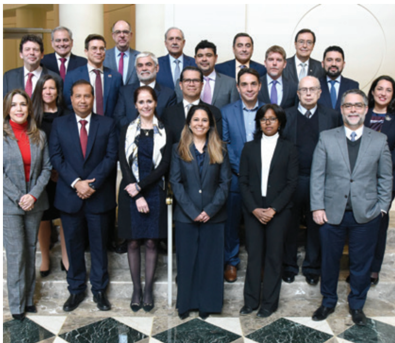
Faltaron: EXD Alberto Nadal (España), EXD Robert Le Hunte (Trinidad y Tobago), EXD Takashi Hanajiri (Japón), EXD Suplente Andrew Clark (Reino Unido).

Los accionistas del BID—sus 48 países miembros— están representados en la Asamblea de Gobernadores, la máxima autoridad del Banco. Los Gobernadores delegan muchas de sus atribuciones al Directorio Ejecutivo, cuyos 14 miembros eligen o designan por períodos de tres años. Los Directores Ejecutivos por Estados Unidos y Canadá representan a sus respectivos países; los restantes representan a grupos de países. El Directorio Ejecutivo incluye también 14 suplentes, que tienen plenos poderes para actuar en ausencia de sus titulares. El Directorio Ejecutivo dirige las operaciones diarias del Banco. Establece las políticas de la institución, aprueba proyectos, fija las tasas de interés de los préstamos, autoriza empréstitos en los mercados de capitales y aprueba el presupuesto administrativo de la institución. La labor de los Directores Ejecutivos se guía por el Reglamento del Directorio Ejecutivo y el Código de Ética para los Directores Ejecutivos. Los temarios y las actas de las reuniones del Directorio Ejecutivo y sus comités permanentes son documentos públicos.