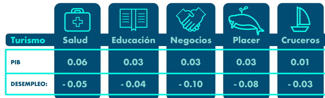
Turismo 15,025 15,030 15,035 15,040 15,045