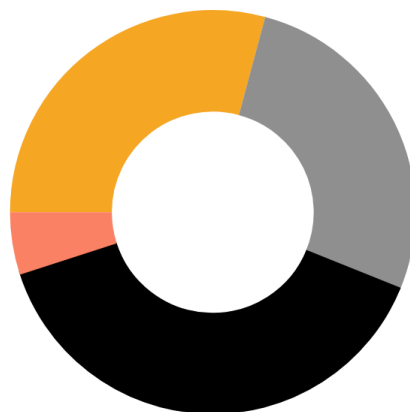
Gráfico 1: Modos de viaje en Jalisco

■ transporte público (29%) ■ transporte privado (27%) ■ transporte no motorizado (39%) ■ otros (5%)