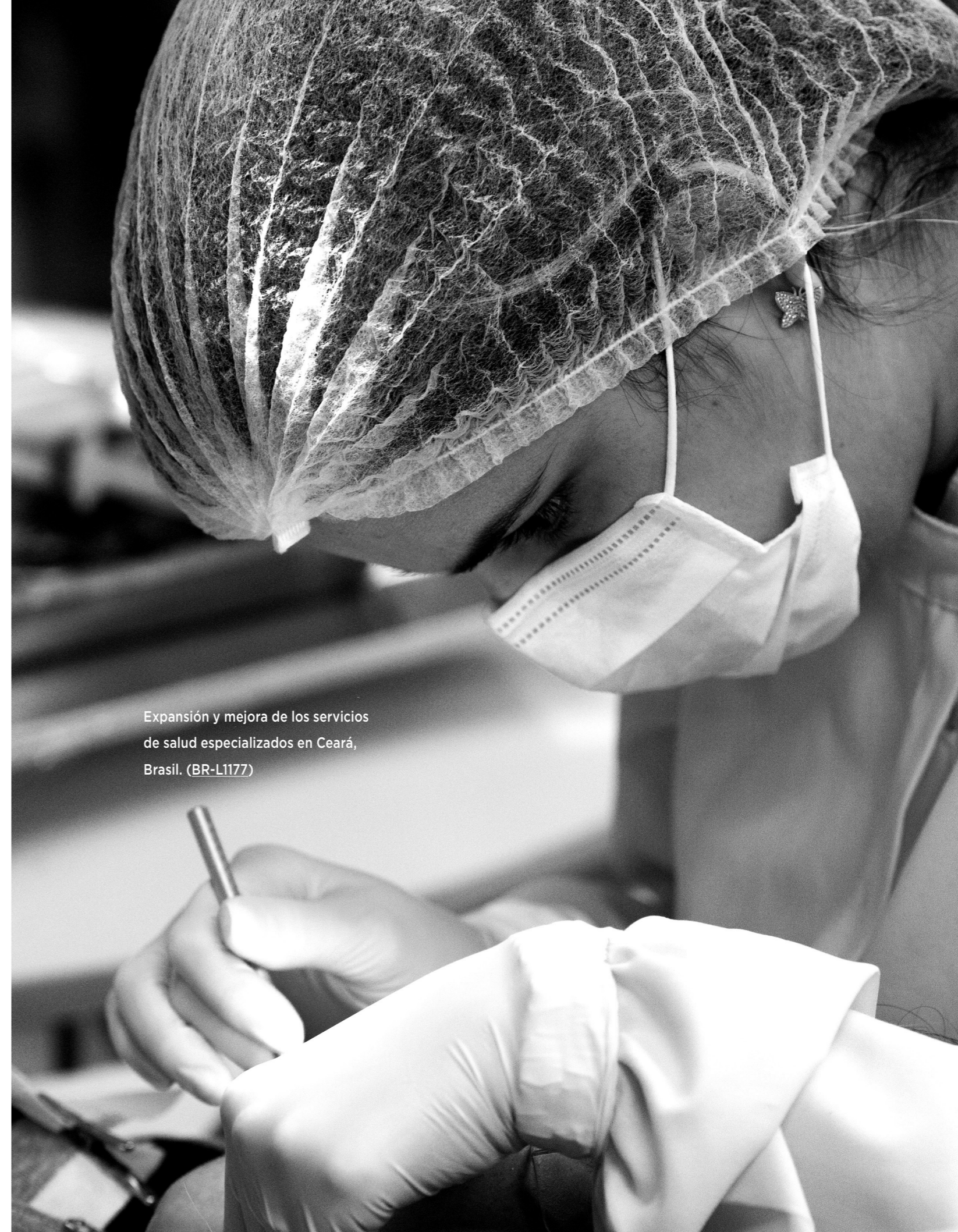
Expansión y mejora de los servicios de salud especializados en Ceará, Brasil. (BR-L1177)

www.iadb.org/es/apoyoareformasdepoliticass