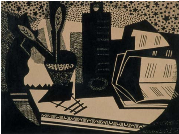
Cuadernos de música , 1919