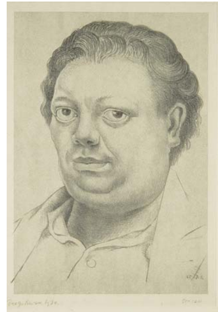
Autorretrato , 1930