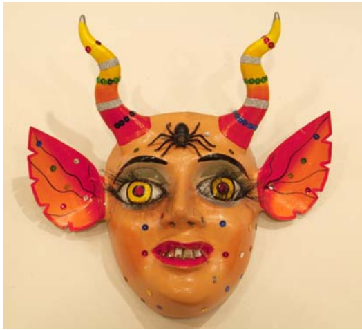
Máscara de la diablada , n/a