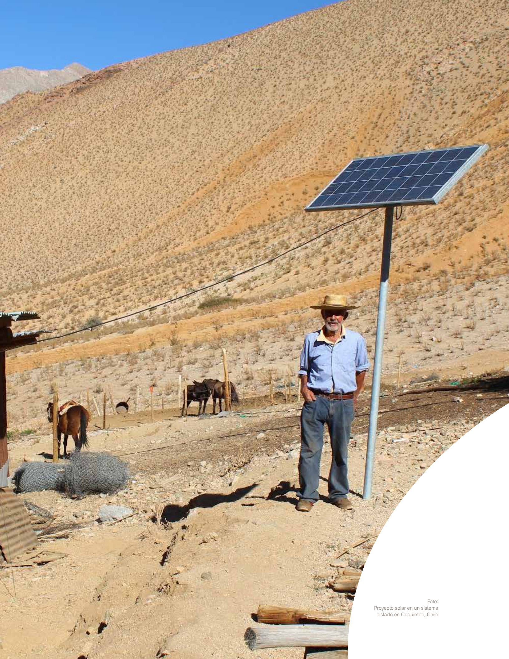
Foto: Proyecto solar en un sistema aislado en Coquimbo, Chile