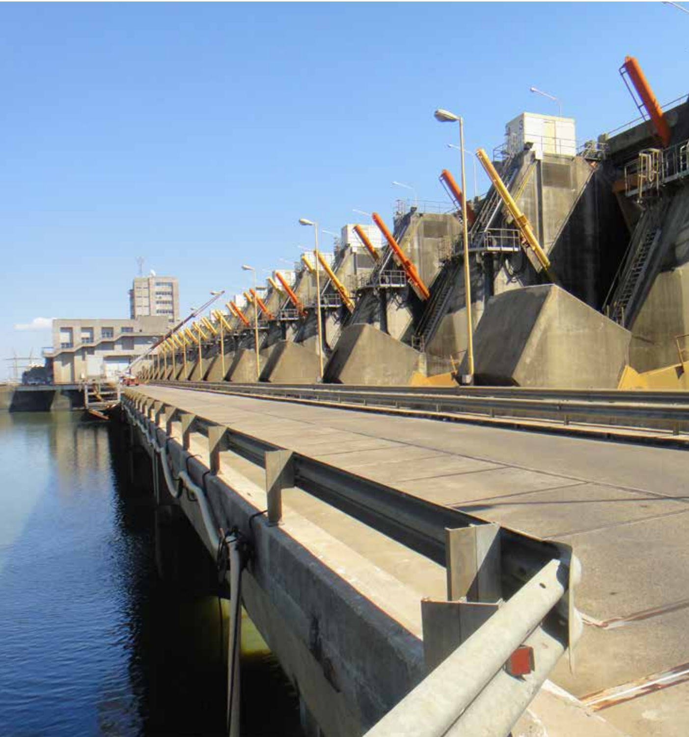
Foto: Yacyretá, Central hidroeléctrica, Argentina & Paraguay