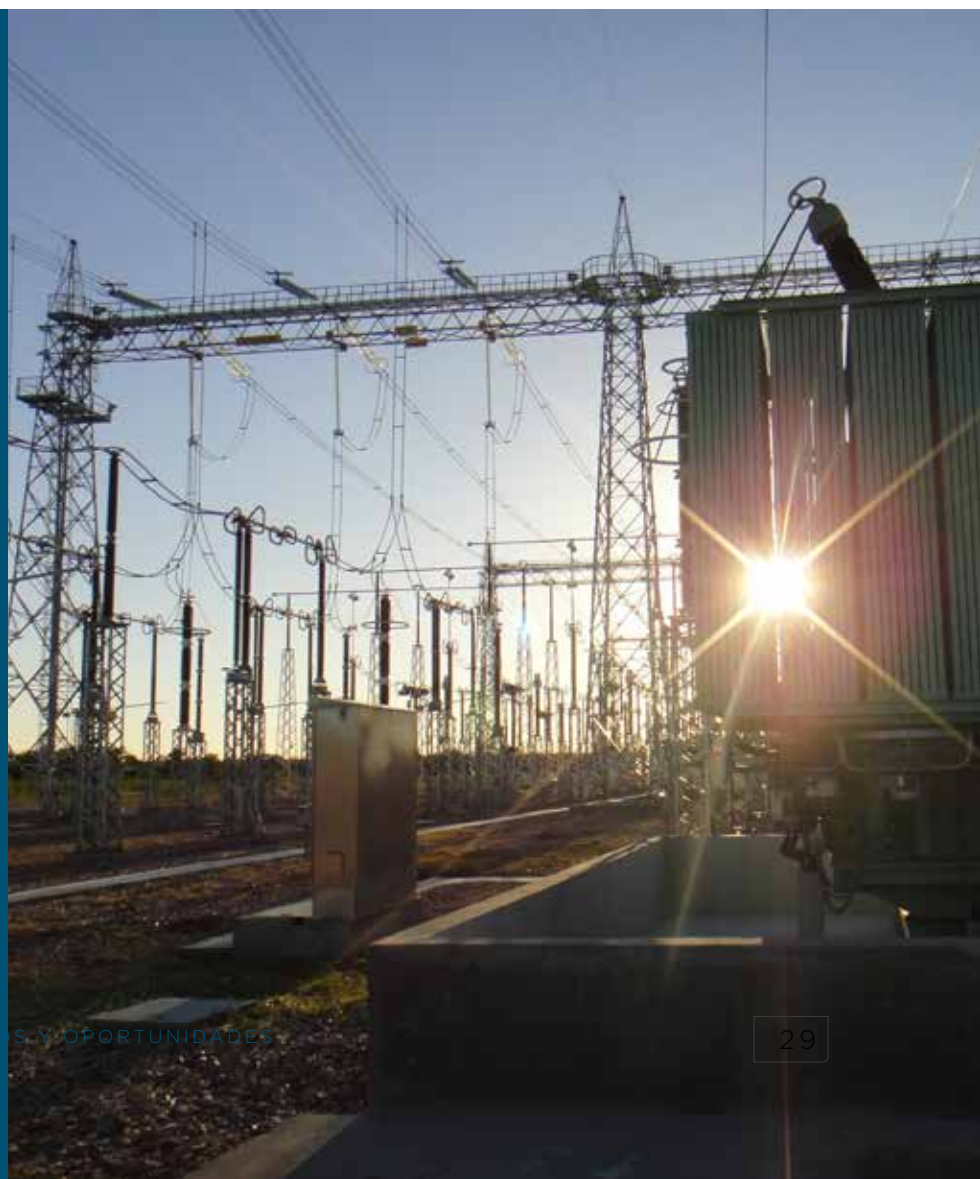
Foto: Subestación Monte Quemado en la provincia de Santiago del Estero, Argentina

El BID ha apoyado a la región de América Latina y el Caribe con asistencia técnica y financiera para mejorar la gobernanza corporativa de las empresas públicas; tal es el caso de Honduras, donde se han hecho reformas sustanciales al sector energético, incluyendo la revisión de los subsidios. El financiamiento del BID también se empleó en Colombia, para ayudar a que las Empresas Públicas de Medellín aborden la gobernanza corporativa y promuevan el apoyo y la colaboración en aspectos como la transparencia, las normas internacionales y la auditoría externa, las cuales son necesarias para los servicios que la compañía ofrece actualmente a nivel internacional.