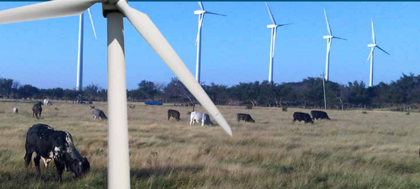
Foto: El Parque Eólico Eurús en Oaxaca, México

Nota: los retrasos originados por el registro de tierras siguen siendo un problema fundamental en México y en el resto de la región de América Latina y el Caribe. El BID debe trabajar con los gobiernos para mejorar los títulos y el registro de tierra en el plano normativo, ya que este hecho es extremadamente importante para grandes proyectos de infraestructura.