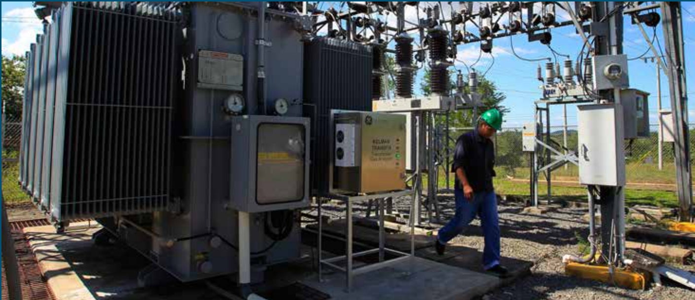
Foto: Programa de apoyo para el sector eléctrico en Corinto, Nicaragua

5.000 luces de alumbrado público reemplazadas