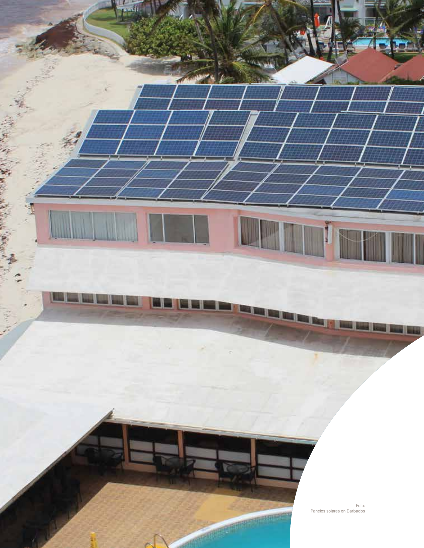
Foto: Paneles solares en Barbados