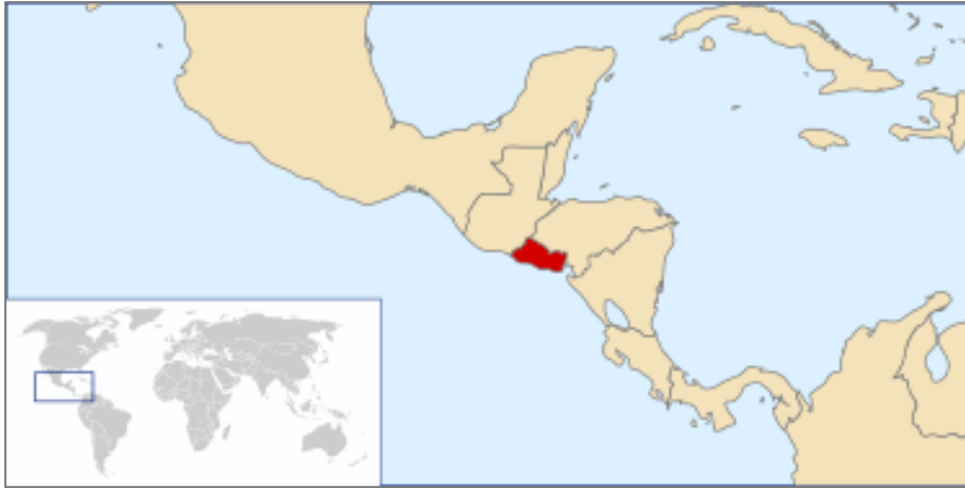
Figura B1. Ubicación de El Salvador en el mundo.

asistencia escolar y piso de tierra de los municipios en el estudio se encuentran por debajo de la media de los municipios que no participan en el estudio.