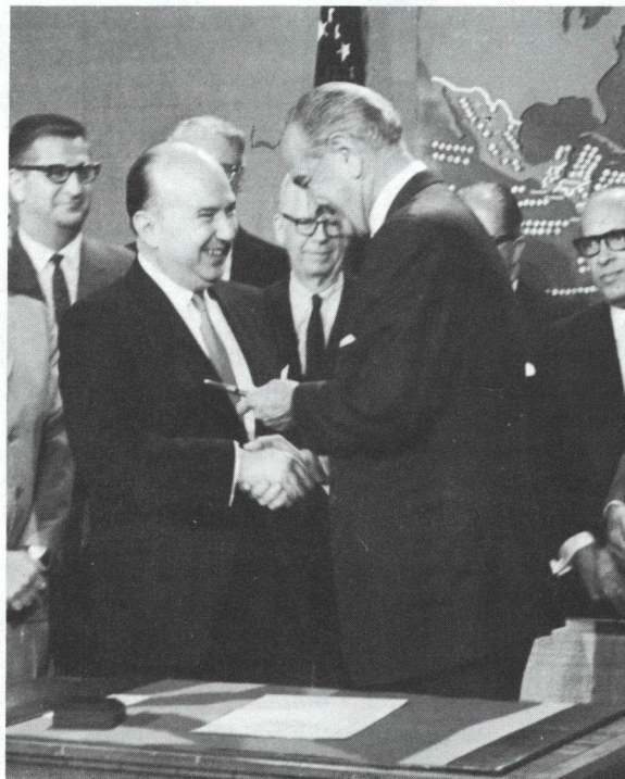
RECURSOS ADICIONALES PARA EL BANCO. El Presidente Johnson entrega al Dr. Felipe Herrera, Presidente del Banco, la pluma con la que acaba de firmar la ley que autoriza una suscripción adicional de parte de los Estados Unidos de $412 millones dentro del aumento de $1.000 millones en el capital exigible autorizado del Banco.

Al firmar la ley, el Presidente Johnson se refirió al Banco como "una institución que responde a las necesidades del presente y con visión de las exigencias y oportunidades del futuro".