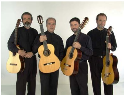
El Cuarteto Brasileño de Guitarras dio inicio a la Serie Interamericana de Conciertos de 2008, el 11 de enero de ese año, en el Centro Cultural del BID.

13 de marzo. En colaboración con la Embajada de Paraguay y la Asociación de Familias del BID, la popular