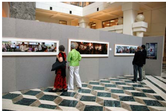
Invitados a la inauguración de la exposición Lejos de casa sobre la experiencia de la migración en América Latina y el Caribe, celebrada en junio, contemplan la obra del artista ecuatoriano Geovanny Verdezoto.

El Programa de Desarrollo Cultural benefició a 1.000 personas en forma directa y a 2.500 en forma indirecta, patrocinó a 45 instituciones y fue motivo de 70 reseñas de prensa en la Región. Contribuyó a fomentar la agenda general del BID; estimuló las buenas relaciones con entidades oficiales y privadas que participaron, en todos los casos, en la gestión y administración de los recursos otorgados; aumentó la cantidad de alianzas con