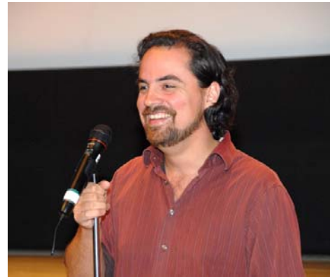
El director de cine Alex Rivera presentó su premiado thriller de ciencia ficción Sleep Dealer en la apertura del XIX Festival de Cine Latinoamericano de Washington, que tuvo lugar en el BID en el mes de septiembre.

En el marco de la 49ª Reunión Anual de Gobernadores del BID, el Centro organizó dos exposiciones. La primera de ellas, denominada Frontera extendida , se llevó a cabo en la Sede y estuvo dedicada al desarrollo de la ciudad de Miami y el papel que ésta desempeñó, a lo largo de la última década, como punto de fusión entre la Región y Estados Unidos; el evento atrajo a más de 2.000 espectadores. La segunda, titulada Más allá de las fronteras , se celebró en la Torre de la Libertad, de la misma ciudad, y en ella se exhibieron piezas de la Colección de Arte del BID. Organizado en colaboración con el Miami Dade College —el más grande de Estados Unidos, con una población de 150.000 estudiantes, el 75% de los cuales están vinculados a países miembros del Banco—, el evento contó con la presencia de más de 15.000 visitantes. También en relación con Miami, el