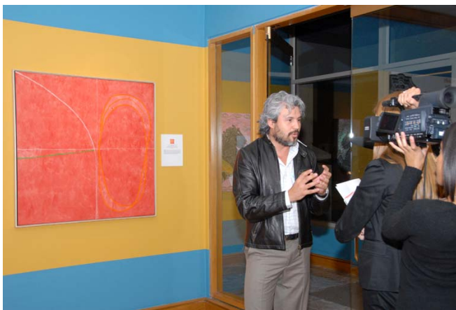
El artista colombiano Mario Vélez habla sobre su pintura Posesiones #55 , perteneciente a la Colección de Arte del BID, en la inauguración de la muestra Frontera extendida: Artistas latinoamericanos y caribeños en Miami .

Sinopsis: La Colección de Arte del BID está integrada por 1.769 piezas provenientes de 45 naciones, entre las cuales se incluyen pinturas, dibujos, grabados, esculturas, tejidos, fotografías y artesanías. Constituye un bien importantísimo del Banco, con un valor que supera los US$2.000.000. El Centro Cultural se ocupa de administrar esta Colección tal como lo estipula el Manual Administrativo del Banco en el AM-402: “Con el objeto de crear una atmósfera atractiva, cálida y funcional, el Banco adquirirá decoraciones, incluidas obras de arte y objetos artesanales, para su exhibición en áreas comunes, tales como vestíbulos, salas de reuniones y comedores de ejecutivos, así como en las oficinas especificadas en el AM-403”.