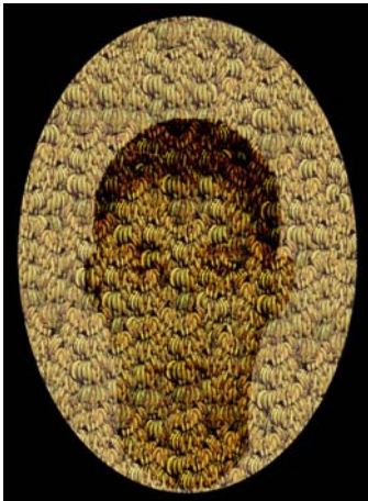
Brother and Plátanos (Hermano y plátanos) , 2005 de Julio Valdez (n. 1969, Santo Domingo, República Dominicana), grabado sobre papel; 55,8 x 76,2 cm.

La atención que los medios dedicaron a las actividades del Centro se incrementó en aproximadamente en 30% con respecto al año 2007, con 7 entrevistas de radio, 27 anuncios televisivos, 300 listados especiales y 298 reseñas de prensa en Estados Unidos, la Región e Italia.