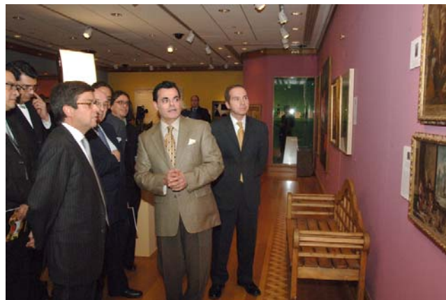
El Presidente del BID, Luis Alberto Moreno (izquierda), en la apertura de la exposición Diplomacia artística: El arte como embajador de América Latina en Washington, D.C. que tuvo lugar en enero de 2008.