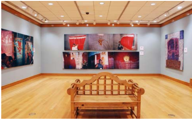
Vista de la exposición “Adentro y afuera: Tendencias recientes en el arte dominicano”, organizada por el Centro Cultural del BID.