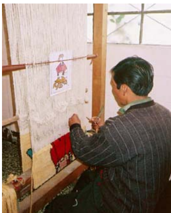
Talleres de capacitación textil en Momostenango para promocionar la producción y el comercio de sus productos en Guatemala.

Instituto Dominicano de Desarrollo Integral