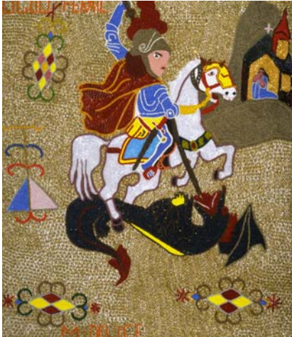
Ogou Ferail [Paladín] , 2004 por Mireille Délice (n. Port-au-Prince, Haití, 1970 - ) lentejuelas, apliques y bordados en tela; 76.2 x 66.04 cm. Préstamo permanente de la Fundación Interamericana de Cultura y Desarrollo, Washington, DC.

Internacional de los Pueblos Indígenas. En diciembre, como telón de fondo del Foro de Género y Diversidad Cultura y desarrollo: Promover la igualdad y la inclusión social , se proyectaron 30 imágenes de obras de arte que expresan la identidad de los descendientes de africanos en la Región.