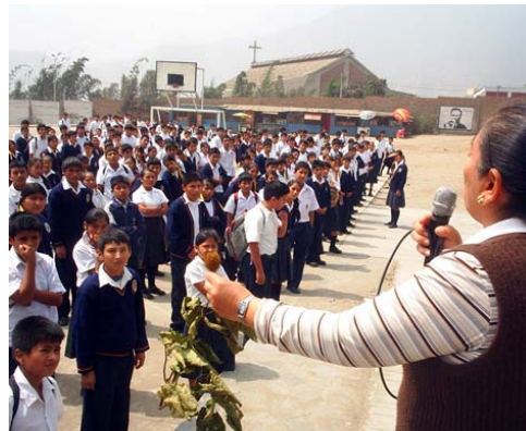
Protección de los sitios arqueológicos de Puruchuco y Huaycán mediante la enseñanza de tradiciones incas a alumnos de escuelas aledañas de Ate y Vitarte, Lima.

En armonía con la misión principal del BID, y con la ayuda de las Representaciones del Banco en los países miembros, el Centro Cultural desembolsó US$240.000 en los 26 países de la Región, con los cuales cofinanció