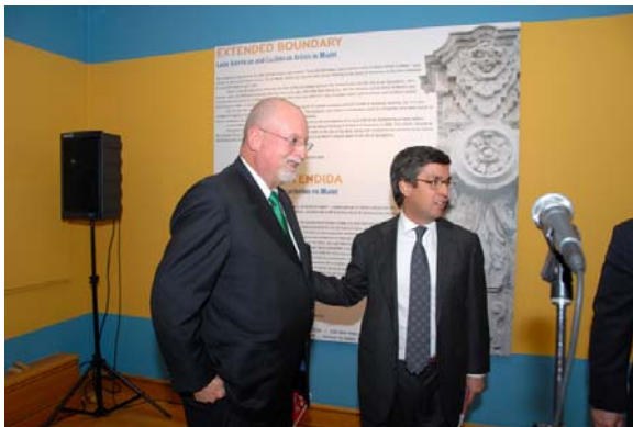
En la inauguración de la muestra Frontera extendida: Artistas latinoamericanos y caribeños en Miami , el Presidente Luis Alberto Moreno presentó a Ricardo Pau-Llosa, crítico de arte de Miami y autor de uno de los ensayos incluidos en el catálogo de la exposición.

El Programa también otorgó 19 pequeñas contribuciones a organizaciones de la ciudad de Washington vinculadas a comunidades de América Latina y el Caribe que residen en la capital de la nación. En la implementación de iniciativas, el Centro colaboró con otras dependencias del BID, tales como el Fondo Multilateral de Inversiones (FOMIN) y el Departamento del Sector Social. Por ejemplo, se organizó una muestra patrocinada por el FOMIN sobre el tema de la migración (en el contexto de las remesas), cuya convocatoria recibió más de 150 inscripciones provenientes de toda la Región y otros lugares.