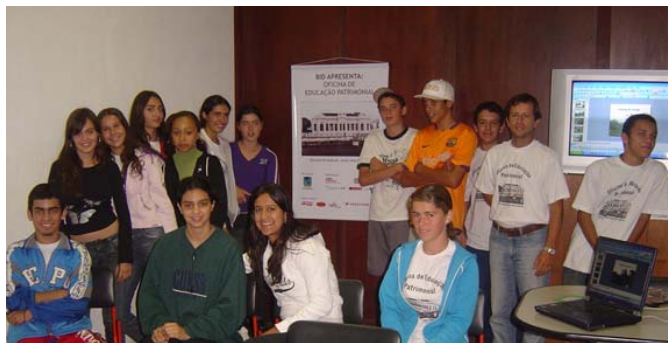
Fundación de la Oficina de Educación Patrimonial en el Museo Regional de São João del Rei, en Minas Gerais, Brasil.