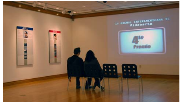
Proyección en la galería de arte del Centro Cultural del BID durante la “IV Bienal Interamericana de Videoarte”.

Centro Cultural en esta exposición celebrada en la Torre de la Libertad; en ocasión de la 49na. Reunión Anual de Gobernadores del BID, se exhibieron 63 obras de arte que integran la Colección del Banco.