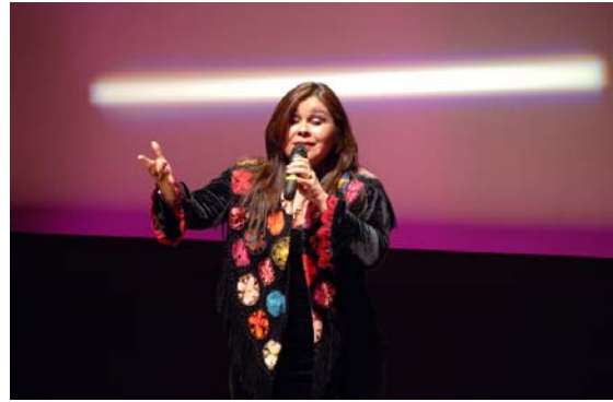
La celebrada cantante folclórica paraguaya Lizza Bogado interpretó canciones de su último CD, Sueño guaraní .

cantante folclórica paraguaya Lizza Bogado , que ha grabado ya 15 álbumes, interpretó canciones de su nuevo CD doble Sueño guaraní , acompañada de guitarra y arpa paraguaya de madera.