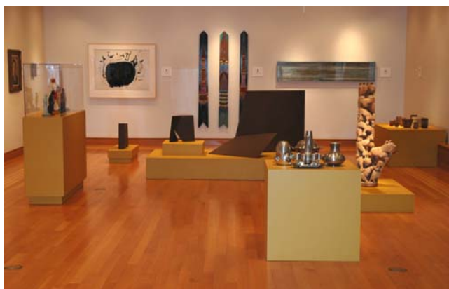
Panorámica de la exhibición titulada "Un Bello Horizonte: Las Artes de Minas Gerais, Brasil", presentada en la galería de arte del Centro Cultural del BID de febrero a mayo de 2006.

CNN, Caracol y numerosas emisoras de radio y periódicos, tanto en Chile como en el resto de América Latina y España. El segundo evento fue la première en Washington de La fiesta del chivo , película basada en la magnífica novela de Mario Vargas Llosa, con la actuación y la presencia de Isabella Rossellini, estrella del filme, y del director peruano Luis Llosa. La prensa de Estados Unidos, América Latina y España se hizo amplio eco de este importante acontecimiento cinematográfico.