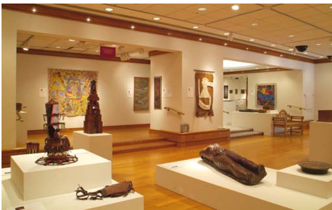
Galería de arte del Centro Cultural del BID con la instalación de la exposición “Las Artes de Guyana: Una Aventura Multicultural en el Caribe”.