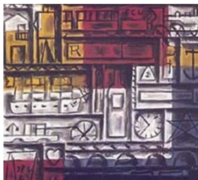
Joaquín Torres García • Uruguay Montevideo, Uruguay, 1874—Montevideo, Uruguay, 1949 Composición constructivista , 1943 óleo sobre tela; 68,6 x 76,8 cm OEA, Museo de Arte de las Américas, Regalo de Nelson Rockefeller, 1963