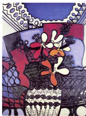
Amelia Peláez • Cuba Yaguajay, Cuba, 1896—La Habana, Cuba, 1968 Marpacífico [Hibiscus] , 1943 óleo sobre tela; 115,5 x 89,5 cm OEA, Museo de Arte de las Américas, Regalo de IBM, 1969