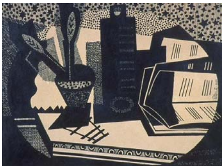
Emilio Pettoruti • Argentina La Plata, Argentina, 1892—París, Francia, 1971 Cuadernos de música , 1919 tinta sobre papel; 19,05 x 24,13 cm Colección de Arte del Banco Interamericano de Desarrollo