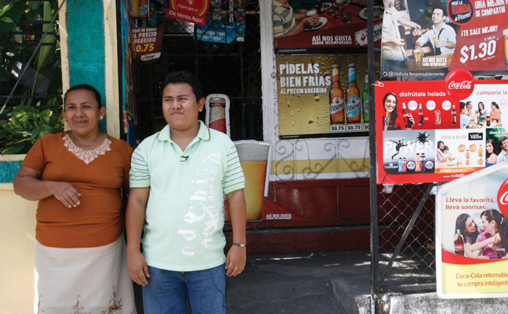
En la foto dos de los beneficiarios del programa de entrada a la BDP de Banco Agrícola. Figuran entre un estimado de 8.000 empresarios que esperan tener acceso a financiación para el 2017.