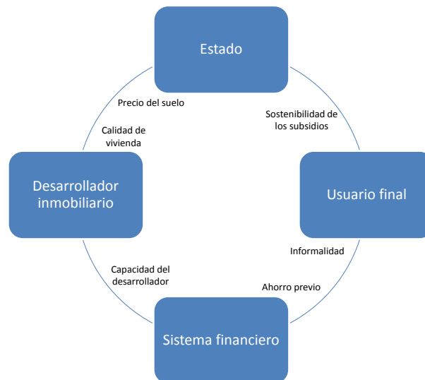
Gráfico 1: Ecosistema del mercado de vivienda

En este marco cobra importancia el concepto de asequibilidad de vivienda formal (AVF), definido como la capacidad de un hogar para: i) comprar directamente o ii) reunir las condiciones para acceder a financiamiento privado para adquirir una vivienda, construida de acuerdo con los códigos vigentes de construcción en terrenos legalmente divididos y urbanizados (Bouillon, 2012).