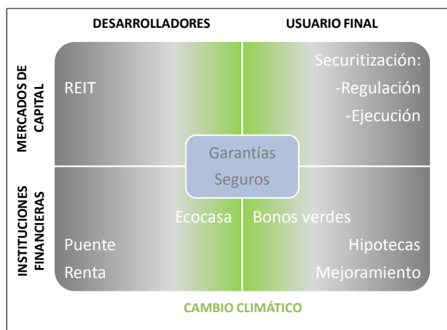
Gráfico 3: Oferta del BID para BND

El gráfico 3 ofrece una visión integrada de los mercados para el financiamiento de la vivienda y los beneficiarios tanto intermedios (desarrolladores) como finales (usuario final), así como de las herramientas disponibles para intervenir brindando soluciones adecuadas para cada caso y cada situación en particular.