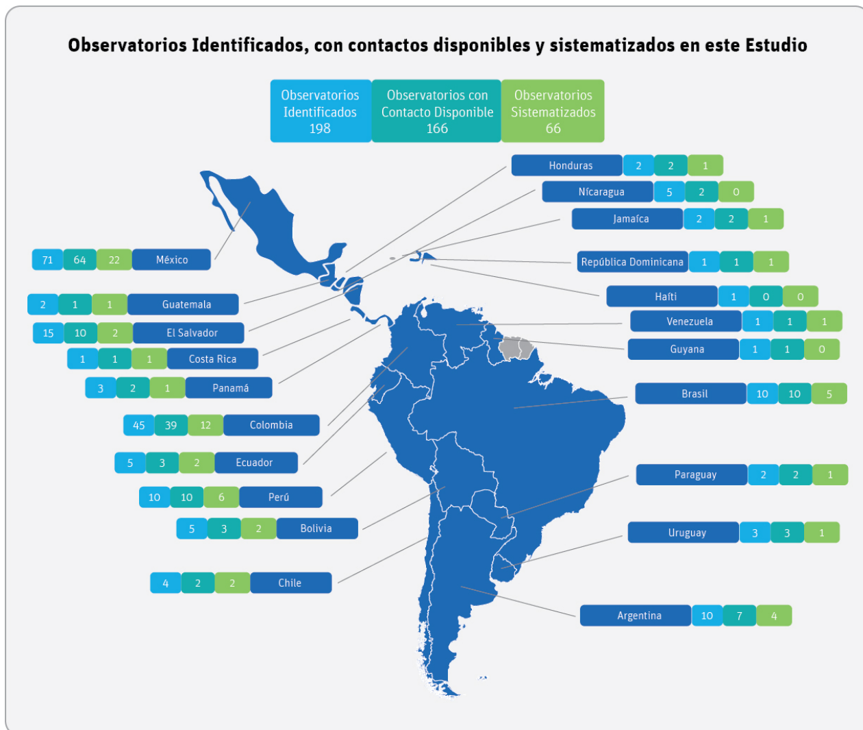
Cuadro 3: Observatorios identificados, con contactos disponibles y sistematizados en este estudio

En la siguiente página: Tabla 1: Observatorios del Crimen y la Violencia Incorporados en el Estudio.