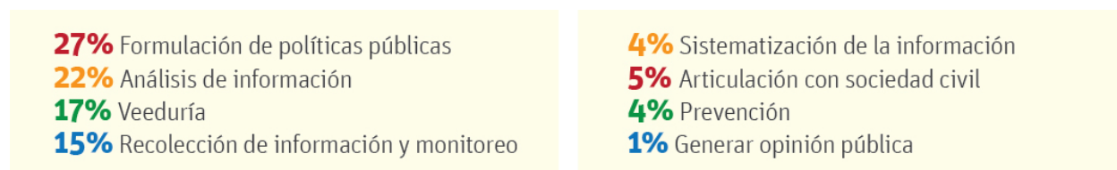
Cuadro 4: Objetivos de los observatorios

Se encontró diversidad de enfoques y finalidades entre los objetivos de los 66 observatorios analizados. De manera general se puede establecer que existen metas múltiples, muchas veces superpuestas o incluso difusas 46 . A nivel individual, el objetivo más frecuente declarado por los observatorios relevados es el de apoyo a la formulación de políticas públicas (27 %), seguido por el análisis de información de crimen y violencia (22%), y la veeduría (17%) 47 . Sin embargo, profundizando en las respuestas recibidas, surge que en la gran mayoría de los casos no se articulan procesos de planificación con productos y resultados precisos ligados al logro esos fines y la medición de desempeño.