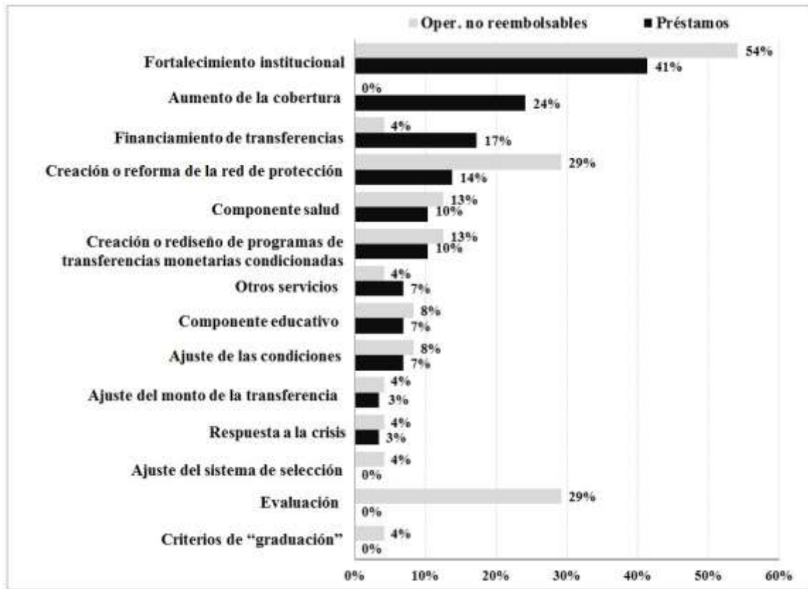
Gráfico B.1 Porcentaje de proyectos que tienen por lo menos un componente de un programa de transferencias condicionadas de efectivo (69 préstamos y 45 operaciones no reembolsables en 20 países)